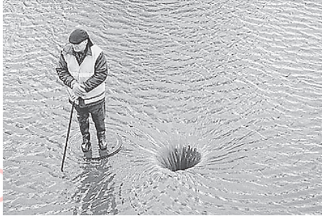
Abbildung 4: Division durch eine recht kleine Null. Entweder das, oder jemand hat die Spülung betätigt.