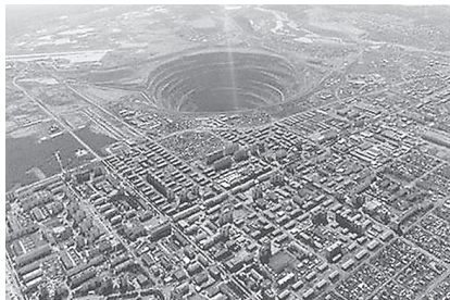
Abbildung 3: Division durch eine recht große Null.

Wenn ich beweisen kann, dass 2 = 1 ist, dann habe ich den logischen Super-GAU. Denn dann kann ich alles beweisen: dass ich der Papst bin, dass die Erde eine Scheibe ist, einfach jeden Unsinn. Um das zu vermeiden, wird die Division durch null illegalisiert.