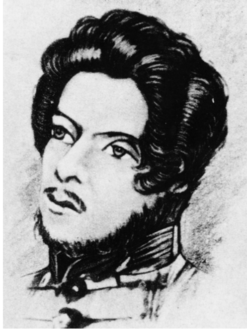
Karl Marx als Student in Bonn 1836, in der Uniform der studentischen Landsmannschaft der «Trierer»

Heinrich hielt deshalb einen Wechsel der Universität für geboten. Am Ende des akademischen Jahres 1835/36 ließ er die Universität Bonn offiziell wissen: «Ich ertheile meinem Sohne Carl Marx nicht allein die Erlaubniß, sondern es ist mein Wille, daß er das nächste Semester die Universität zu Berlin beziehe, um daselbst seine zu Bonn angefangenen Studien der Rechts- und Kameral Wissenschaft fortzusetzen.» 7 Der Wechsel nach Berlin brachte eine bedeutende Änderung in Karls Leben. Der Heimweg zu seiner Familie wurde sehr viel länger und erforderte eine viertägige Fahrt mit der Postkutsche, weil es erst Ende der vierziger Jahre des 19. Jahrhunderts eine Eisenbahnverbindung zwischen der preußischen Hauptstadt und ihren westlichen Provinzen geben sollte. Berlin, mit seinen 300 000 Einwohnern rund zwanzigmal so groß wie Bonn, war von der kleinen rheinischen Universitätsstadt grundverschieden. In Berlin machte Marx Bekanntschaft mit dem Großstadtleben, das für den Rest seines Lebens zur Regel werden sollte.