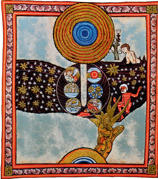
Hildegard von Bingen (1098–1179): Das Hexaemeron

Ganz ähnlich tritt der Raum in Erscheinung. Erst die Trennung von Himmel und Erde, von Licht und Dunkel, von Land und Wasser definieren einen Raum, in dem bestimmte Dinge hier, andere dort sind, diese oben und jene unten. Die Bühne für das kommende Schauspiel, der Raum, musste also auch zunächst erst erschaffen werden. In der heutigen Denkweise könnte deshalb der Eröffnungssatz der Bibel durchaus lauten: «Am Anfang schuf Gott Zeit und Raum.»