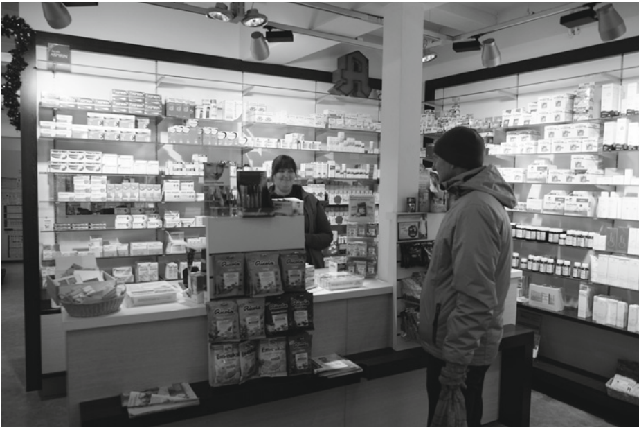
● Abb. 1.2 Verkaufsraum einer Apotheke (Offizin). Getrennt durch den Handverkaufstisch (HV) sieht man dahinter die Bereiche Arzneimittellager der apotheken- und rezeptpflichtigen Medikamente, den Bereich der Selbstmedikation und freiverkäuflichen Arzneimittel und die apothekenüblichen Waren, zu denen die Kosmetik gehört.