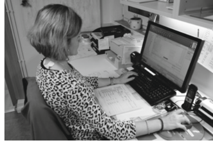
● Abb. 1.5 EDV-Arbeitsplatz einer Apotheke mit Rezeptscanner, an dem mit den eingereichten Rezepten die Heimbelieferung organisiert wird