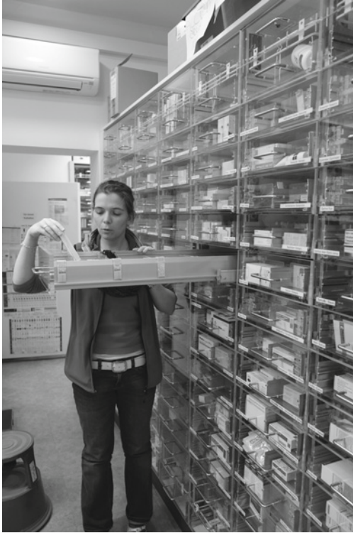
● Abb. 1.3 Teilbereich des Arzneimittel-lagers einer Apotheke. Arzneimittel müs-sen sorgfältig nach vielerlei Kriterien in das Lager einsortiert werden. Eine durchschnittliche Apotheke hat ca. 300–400 Großraumschubladen, die meist eine Länge von über einem Meter haben.