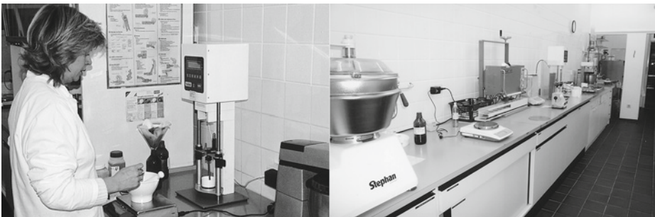
● Abb. 1.6 Apothekenrezeptur, in der Arzneimittel auf ärztliche Verschreibung oder nach einer Rezeptur der Apotheke hergestellt werden