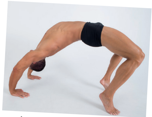
... sondern auch beweglich!

Fitness definiert sich durch mehrere Komponenten: Muskelkraft, Leistung, muskuläre Ausdauer, Herz-Kreislauf-Ausdauer, Schnelligkeit, Koordination, Balance und Beweglichkeit. Meine Workouts sprechen alle diese Aspekte in ihrer Gesamtheit an. Das Praktische dabei ist: Wenn du dich derart umfassend weiterentwickelst, stellen sich die körperlichen Veränderungen ganz von allein ein: die V-Form, eine breite Brust, eine kräftige Bauchmuskulatur und definierte Arme und Beine.