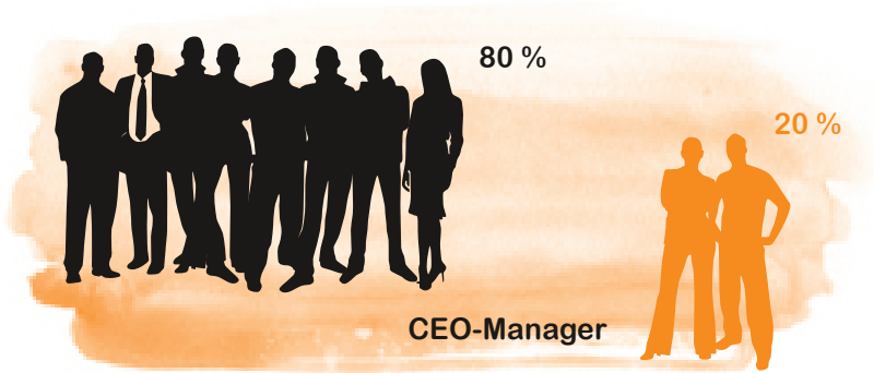
Abbildung 4 Acht von zehn Managern aus der Wirtschaft wünschen sich »radikalere Vorgaben von der Politik«. In anonymen Befragungen fordern sie einen strengeren Ordnungsrahmen, um beim Thema Nachhaltigkeit voranzukommen. 27

Bei der Ökodesignrichtlinie der Europäischen Union gelingt dies schon recht gut: Seit 2009 gibt die EU über diese Richtlinie Anforderungen an die umweltgerechte Gestaltung elektrischer Geräte vor (s. »Die Ökoroutine für Strom«, S. 146). Als kürzlich neue Standards für die Effizienz und Haltbarkeit von Staubsaugern ausgearbeitet wurden, waren Vertreter von Umweltinstituten, Industrieverbänden, der EU-Kommission und den betroffenen Unternehmen wie Hoover, Vorwerk, Miele und Bosch-Siemens beteiligt. Einige wollten ambitionierte Vorgaben, andere besonders hohe Standards. »Die Industrie beklagt sich nicht«, stellte die FAZ fest. 28 Im Gegenteil, die Unternehmen können gut damit leben, dass Standards fortlaufend verbessert werden. Unterm Strich profitieren sie von dem Anreiz, ihre Produkte kontinuierlich verbraucher- und umweltfreundlicher zu machen.