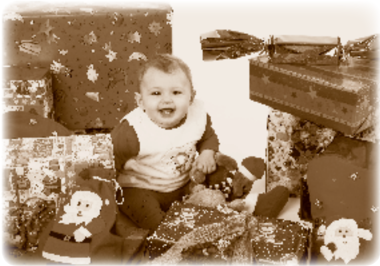
Abbildung 3 Wir leben im totalen Überfluss und sollen durch den Abbau von »Handelsbarrieren« noch wohlhabender werden.

für eine Solarfabrik sind mit den WTO-Regeln ebenso wenig vereinbar wie Vorgaben zur lokalen Wertschöpfung. In Kanadas südöstlicher Provinz Ontario sollten beispielsweise mindestens 40 bis 60 Prozent der Arbeitskräfte und Materialien aus der Region stammen. Nur dann kamen die Lieferanten in den Genuss der Fördergelder. 16 Das gut gemeinte Konzept, Klimaschutz und soziale Sicherung miteinander zu verbinden, endete mit Klagen aus Japan und der Europäischen Union. Die Bestimmungen entsprachen nicht den Regeln für Freihandel und wurden zurückgenommen, und die Investoren entzogen den Solarfabriken in Ontario ihr Kapital. 17