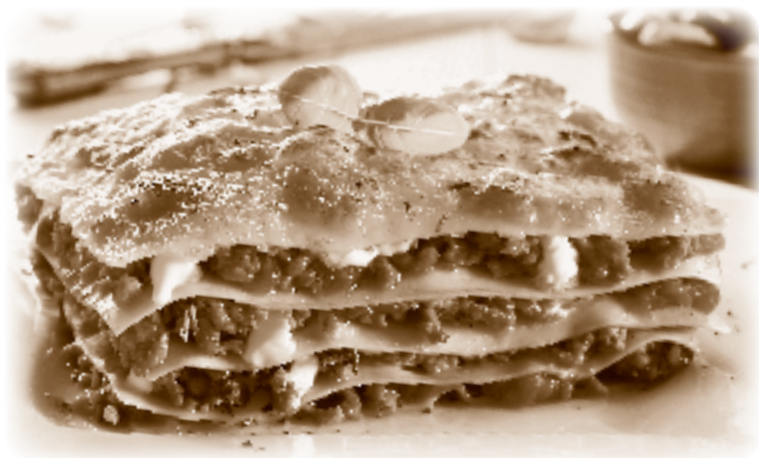
Abbildung 1 Der Pferdefleischbetrug offenbart ein System organisierter Verantwortungslosigkeit. Verstrickte Produktions-, Verarbeitungs- und Lieferketten sind heute der Normalfall. Verantwortungsvolle Produktionsmethoden verlangen das Gegenteil: kurze Transportwege, regionale und nachhaltige Erzeugung, kurze Wertschöpfungsketten, faire Löhne.

Woran hakt es also? Warum scheint die Regiopasta eine ferne Utopie zu sein? Weil der Markt sich so entwickelt, wie es die Rahmenbedingungen vorgeben. Wir lassen es zu, dass Transporte über Tausende Kilometer extrem billig sind, weil wir die Maut nicht vorausschauend anheben oder Kerosin endlich besteuern. Wir bauen Straßen und Flughäfen aus, statt die Expansion zu begrenzen. Wir akzeptieren, dass Waren zu Dumpinglöhnen hergestellt werden. Wir nehmen hin, dass billig vor Qualität geht, dass Lebensmittel aus Biolandbau die Ausnahme sind und nicht die Regel. Wir akzeptieren, dass sich die Produktion unserer Nahrungsmittel in der Hand von Finanzjongleuren befindet, die keinen Gedanken an die Gesundheit der Kunden, die Klimawirkung ihrer Produktion und die Arbeitsverhältnisse in den Betrieben verschwenden. Wenn sie es doch tun, dann nur, weil es zum Nachteil für ihre Rendite sein könnte.