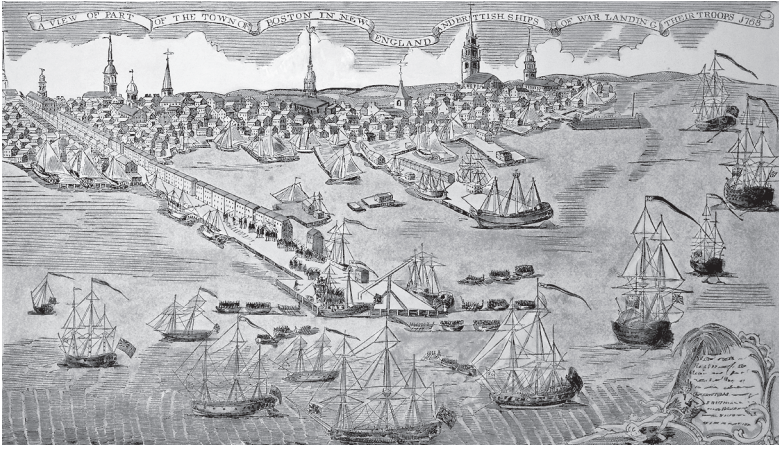
Hafensicht von Boston um 1770, handkolorierter Stich von Paul Revere, 1768.