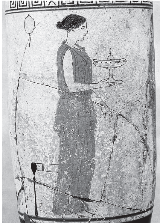
Abb. 2 Frau mit Schale als Gabe an einen Toten. Attische Vasenmalerei, fünftes Jahrhundert v. Chr.

Die zentrale Rolle der Bestattungsriten, des Opferkults für die Toten und der Unterscheidung zwischen gewöhnlichen und herausragenden Verstorbenen bei den Griechen brachte es mit sich, dass sie diesen Aspekten auch bei ihren schriftlosen Nachbarvölkern besondere Beachtung schenkten. Angaben dazu bilden seit dem fünften Jahrhundert v. Chr. einen festen Bestandteil der ethnographischen Schilderungen, die Historiker gemäß einer literarischen Konvention ihren Darstellungen der geschichtlichen Abläufe beigaben. Am Anfang steht dabei Herodot mit seiner ausführlichen Beschreibung der Bestattungssitten bei den Skythen ( Historien 4,71–72): Ihm zufolge wurden die Leichen der skythischen Könige einbalsamiert, mit Wachs überzogen und auf einem Wagen von einem Stamm zum anderen geführt, um die dem Toten gebührenden Trauerriten zu vollziehen. Anschließend wurde der